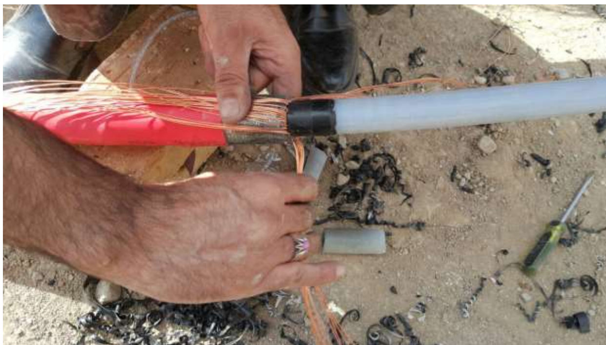
تصویر شماره ۸_۱