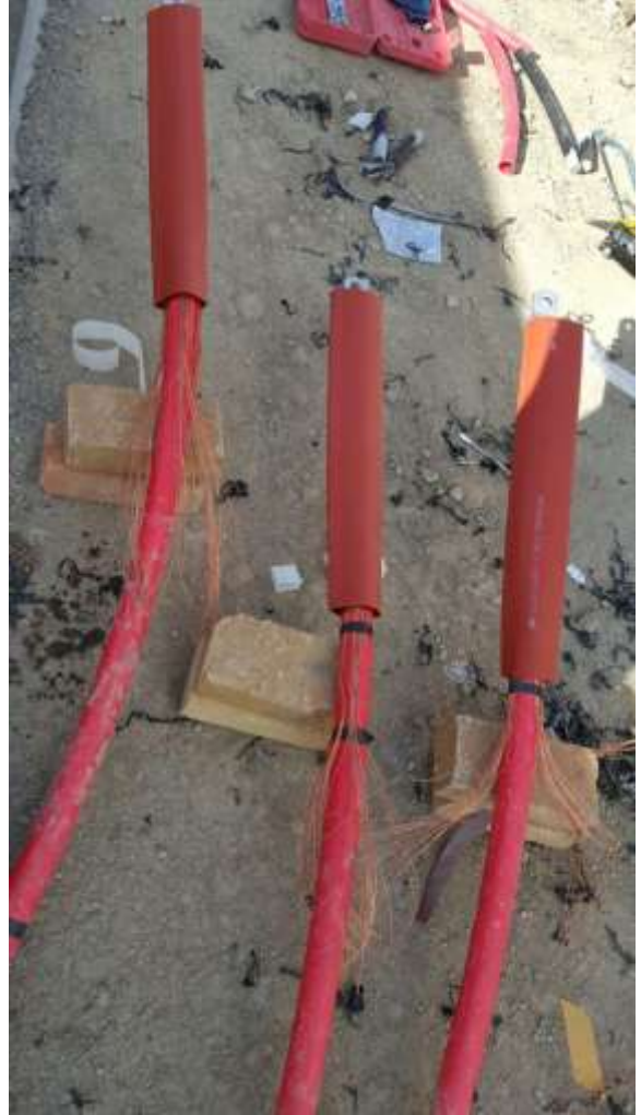
تصویر شماره ۱۳