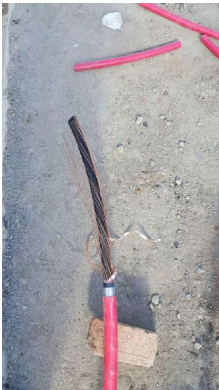
تصویر شماره ۴ شیلد کابل را به سمت پایین کابل میبریم