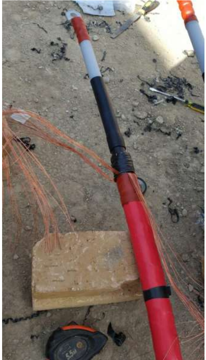
تصویر شماره ۱_۱۲