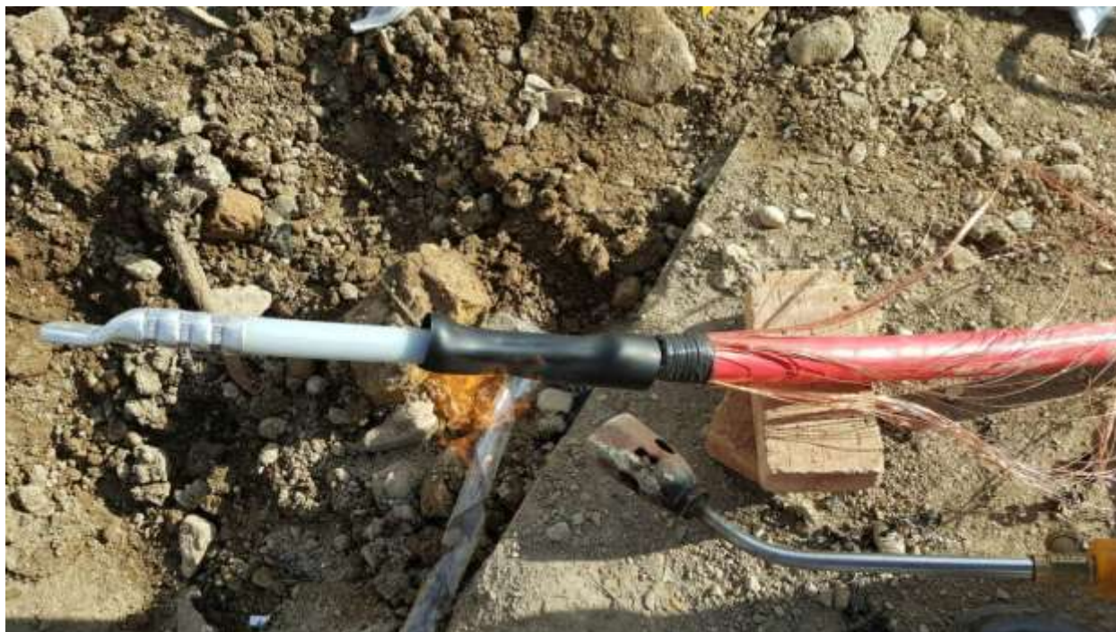
تصویر شماره ۱۰-۱