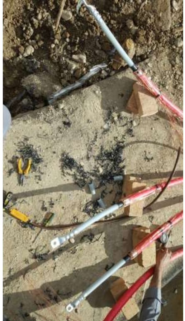
تصویر شماره ۷_۱