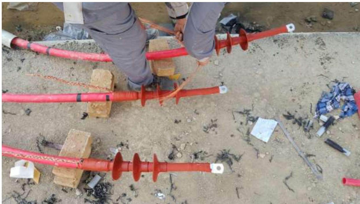
تصویر نهایی سر کابل ها ۱۶