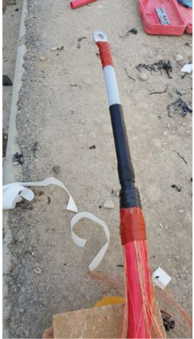
تصویر شماره ۱_۱۲