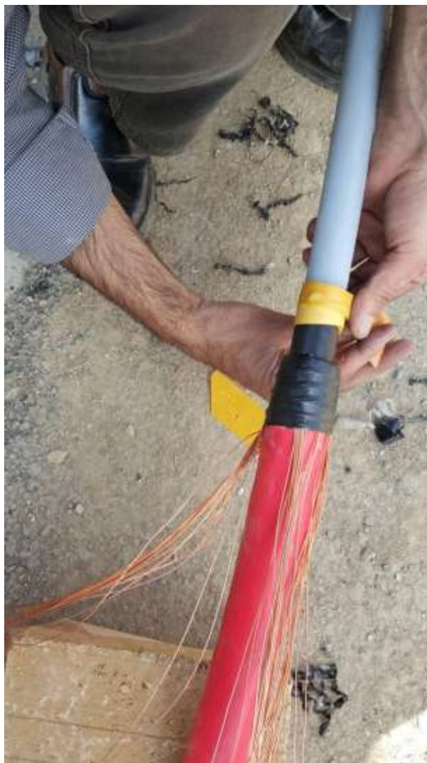
تصویر شماره ۹_۱