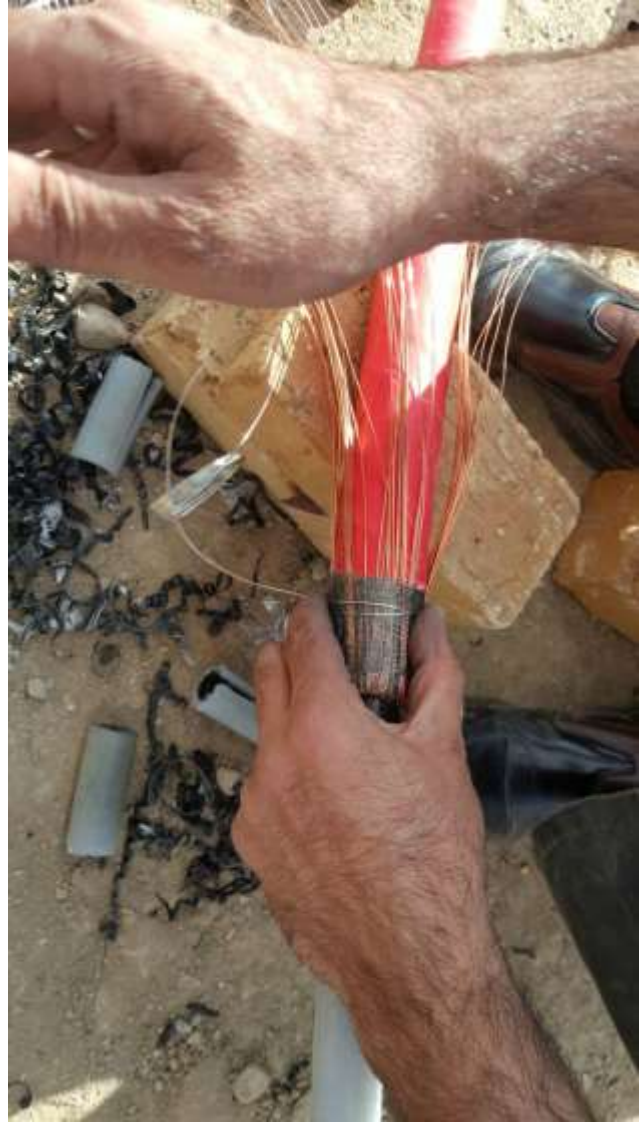
تصویر شماره ۲_۸

تصویر شماره ۸ از ۴ سانتی متری که بین پوسته اصلی برای زره گذاشته بودیم با نوار توری مسی از شیلد کابل جدا میکنیم