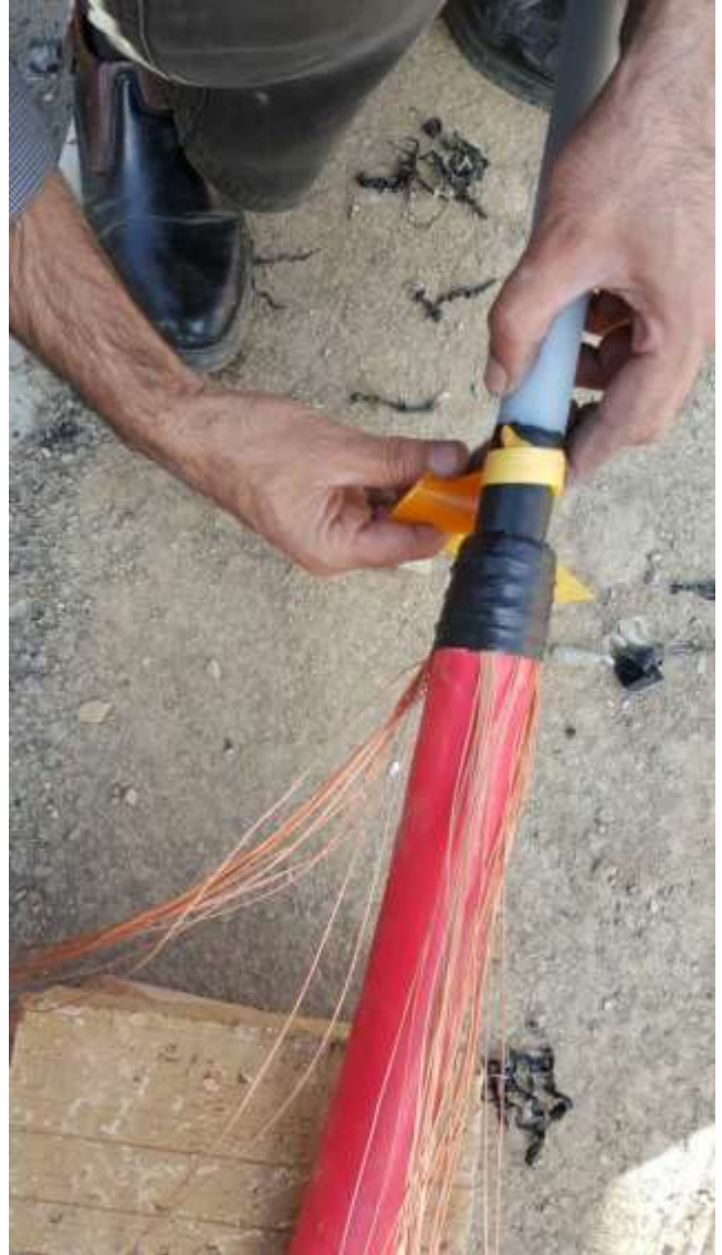
تصویر شماره ۹