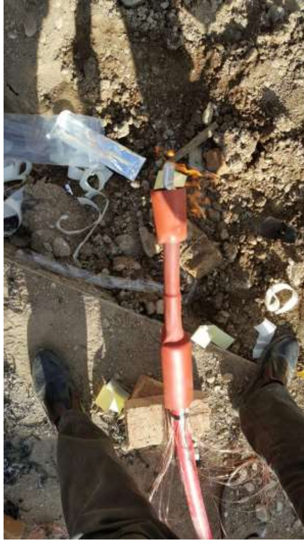
تصویر شماره ۱_۱۳