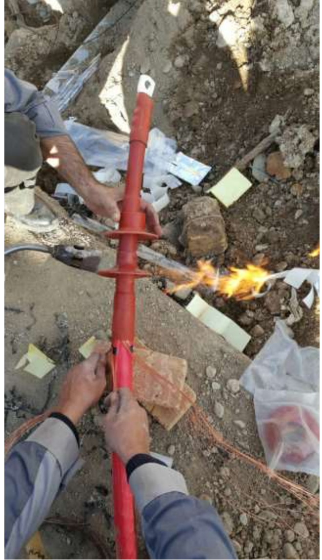
تصویر شماره ۱۴