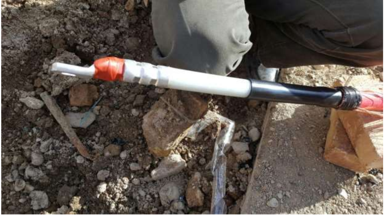
تصویر شماره ۱۱