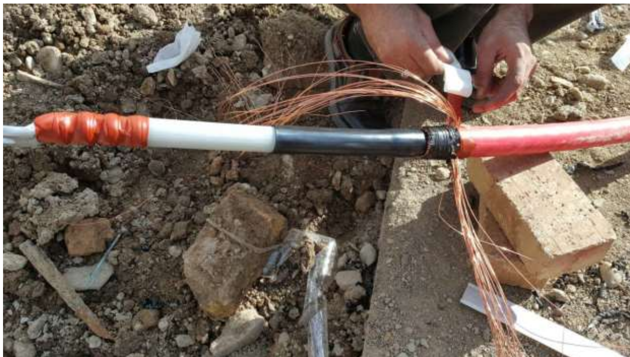
تصویر شماره ۱۱_۲