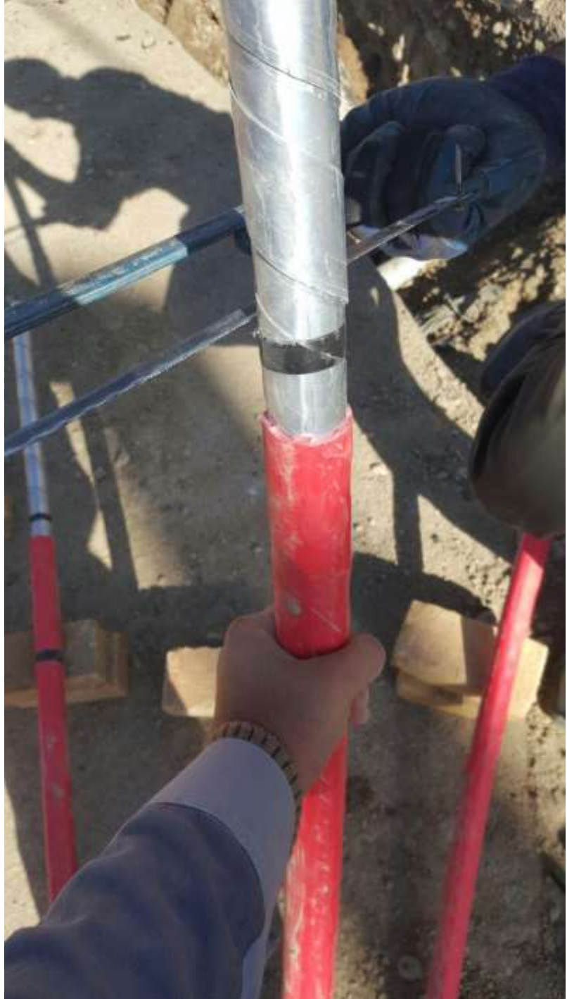
تصویر شماره ۱_۱

و اگر کابل زره دار بود به اندازه ۴ سانتی متر از زره را توسط یک نوار چسب مشخص میکنیم و زره را بر میداریم