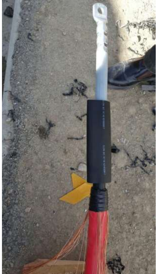
تصویر شماره ۱۰