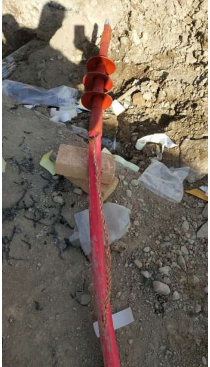
تصویر شماره ۱۵ بافتن شیلد کابل