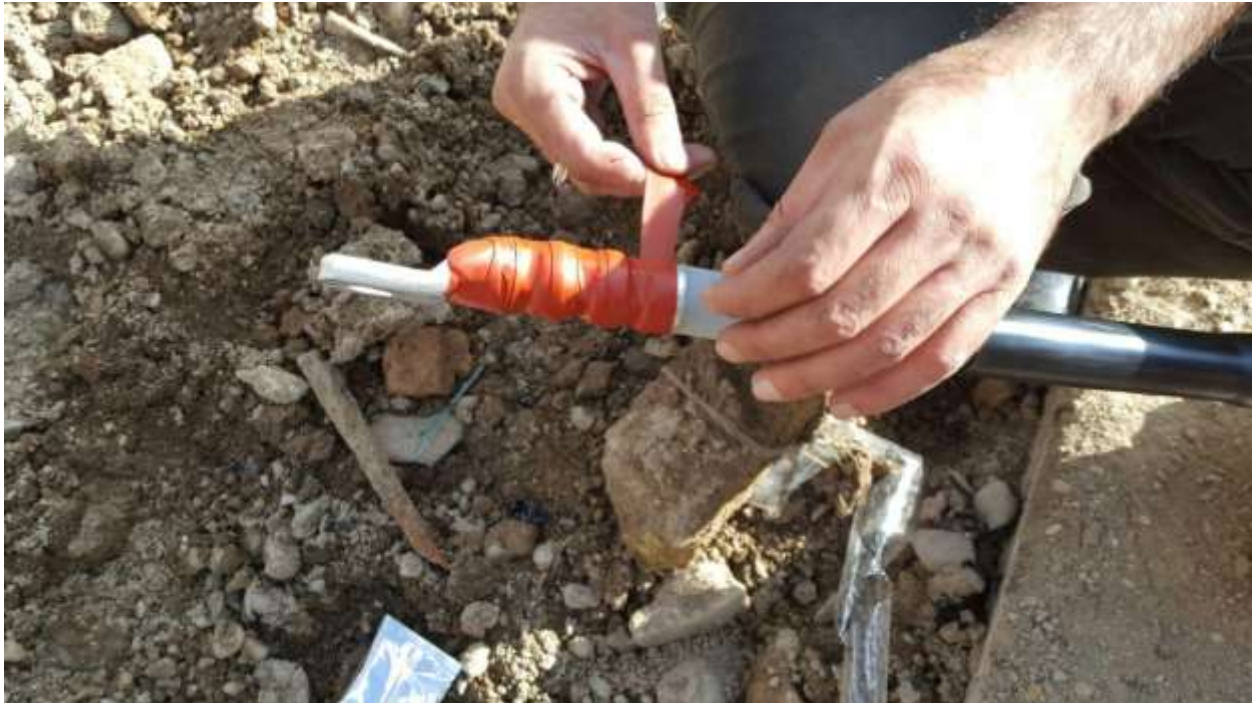
تصویر شماره ۱_۱۱