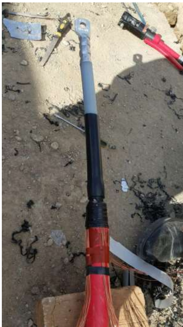
تصویر شماره ۱۰_۳