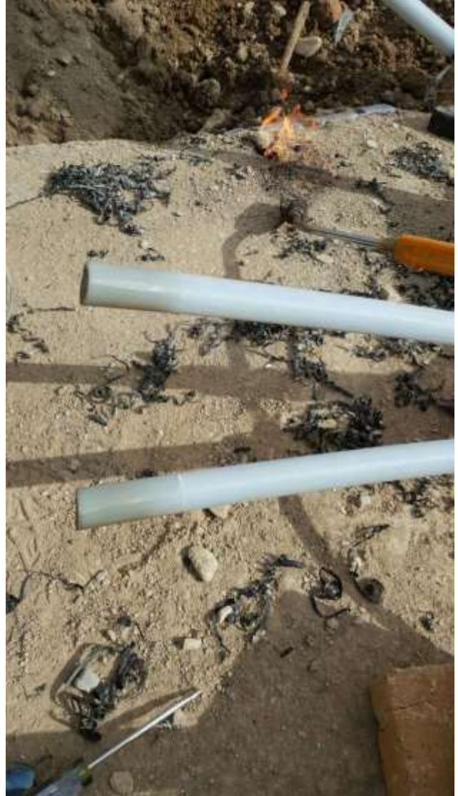
تصویر شماره ۷ برداشتن عایق برای نصب کابل شو