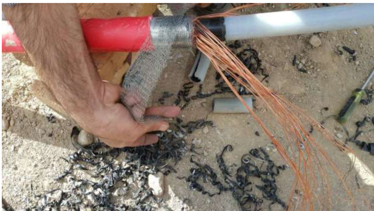
تصویر شماره ۸