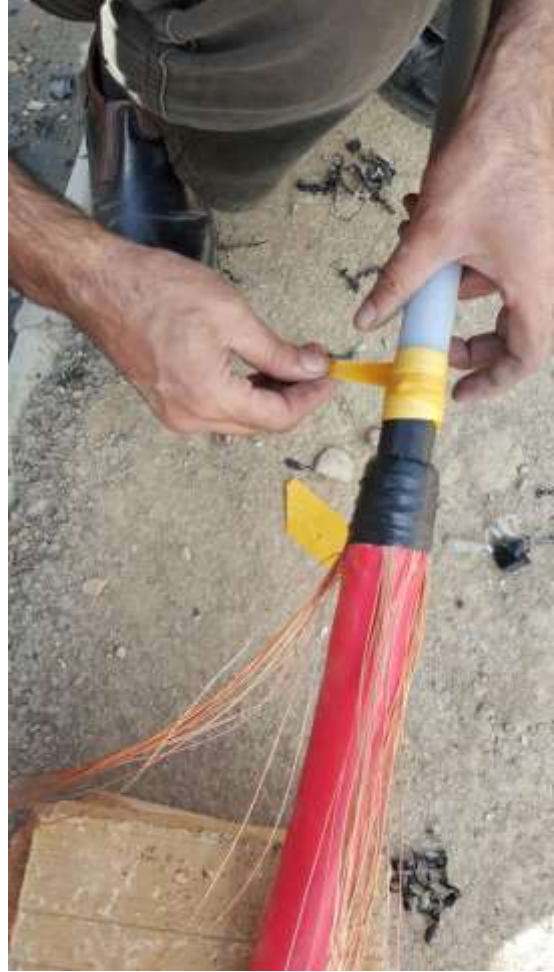
تصویر شماره ۹_۱