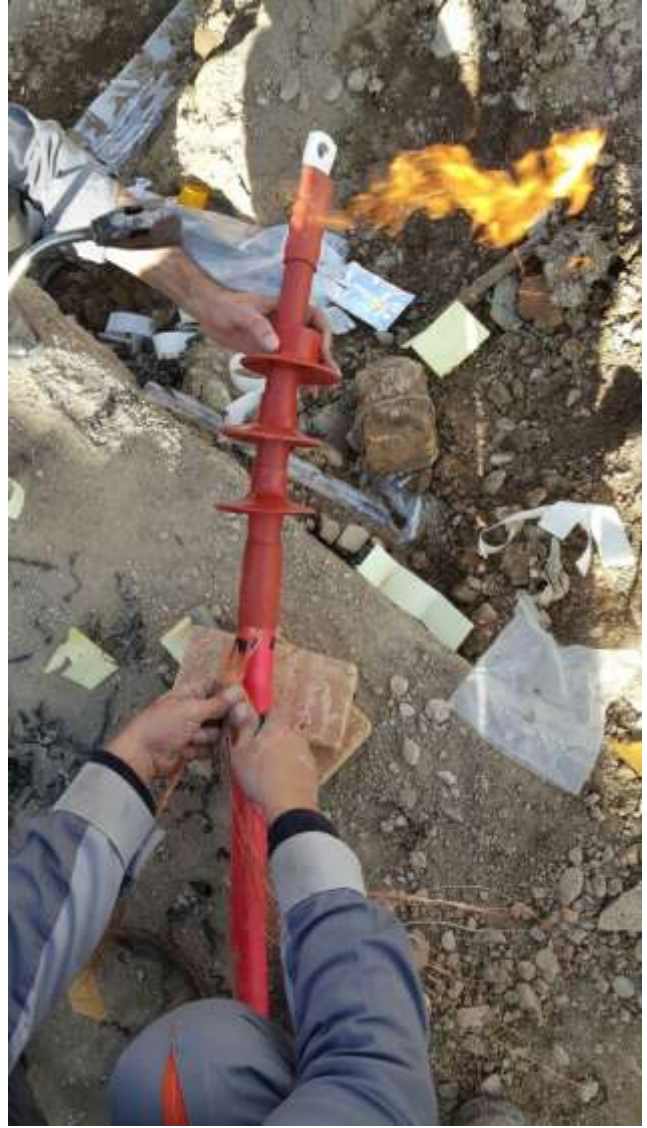
تصویر شماره ۱_۱۴